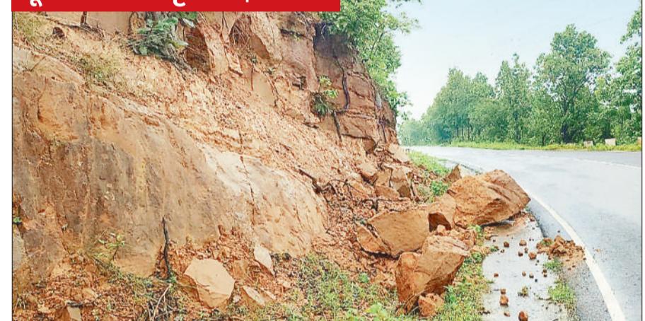
बैकुण्ठपुर। जिले के सोनहत मार्ग पर शिवघाटी क्षेत्र में भारी बारिश की वजह से सड़क किनारे घाटी क्षेत्र में भू-स्खलन से बड़ा चट्टान सड़क किनारे गिरा। कम ऊंचाई होने के कारण भू-स्खलन के दौरान गिरा चट्टान सड़क किनारे ही स्थित हो गया।