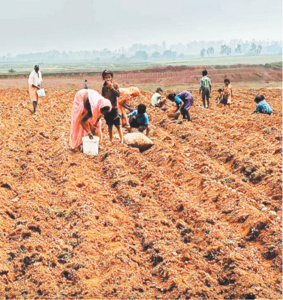
आलू लगाते कृषक।